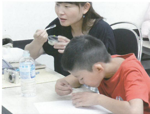
採れる時期で変わる味を確かめました。