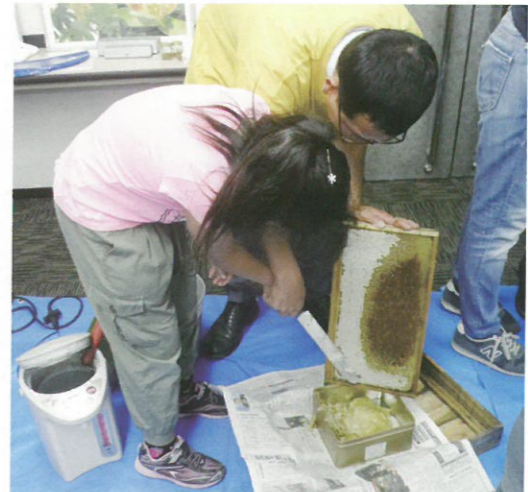
巣枠の表面の膜を切ります。

令和5年6月18日第三種郵便物認可 育て！子どもたち 令和元年10月24日発行 第1924号 定価400円(毎週木曜日発行) 発行所 (株)産経広告社 〒101-0052 東京都千代田区神田小川町1-1 TEL 03-5259-8810