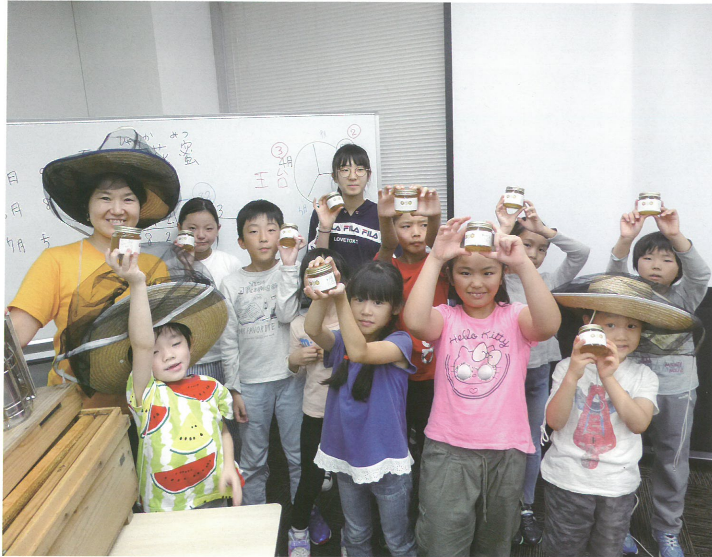
ミツバチがいろいろな花から蜜を集めた「百花蜜」が採れました。