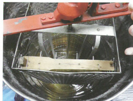
遠心分離器でグルグル回します。