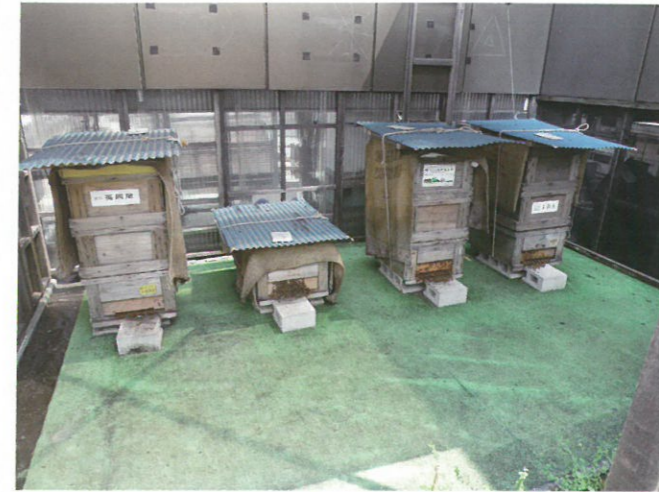
屋上の巣箱を見に行きました。