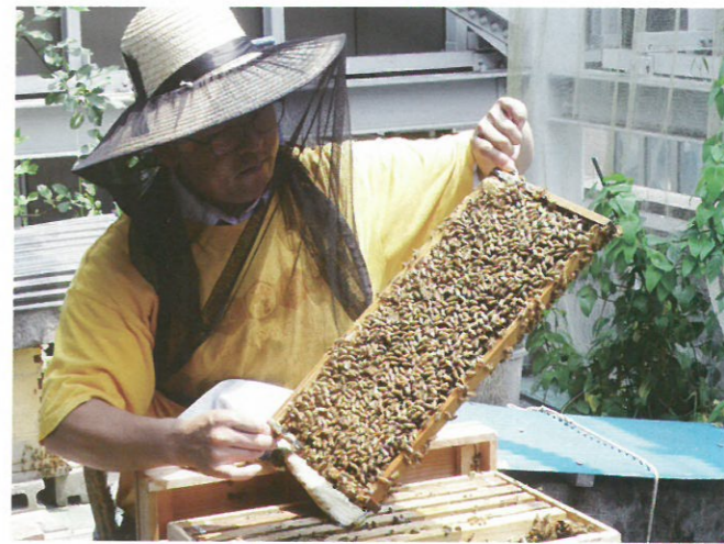
元気なミツバチがいっぱい！