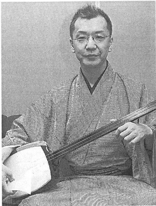
「三味線を身近に聴けるものになりたい」と話す紫文さん