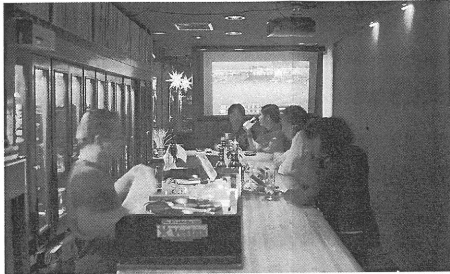
ジャズが流れる中、マスターとおしゃべりも楽しい小さなバー「Deep」=東京都新宿区

クラシックピアノを学んだが大学時代からジャズにのめり込み、演奏家になると決意。二十六歳のときに、荒木町近くのアパートで一人暮らしを始めた。ランドピアノは置かず、アップライトをク