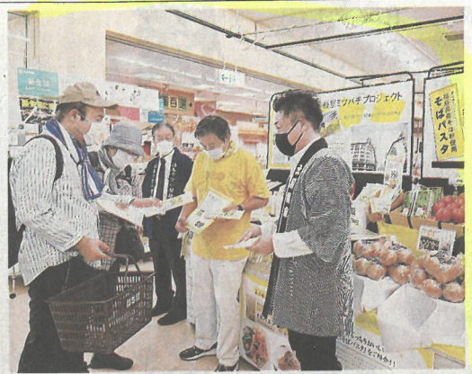
そばパスタを買い求める来店客

人機一体の開発技術を実験する会津大生 企業との座談会も開かれた。学生は最先端のコンピュータ技術や、ものづくりにかける熱い思いに触れた。