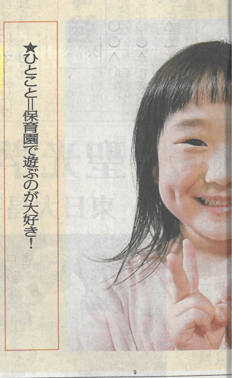
★ひとこと「保育園で遊ぶのが大好き！」

鮫川産の新鮮野菜を買い求める来場者 国の自治体などが出展するイベントで、県内からいわき市のスパリゾートハワイアンズとともにブースを構えた。 村内で採れたキュウリ、ナス、ピーマンなどの新鮮野菜は完売し、豆菓子やきな粉などの大豆加工品も注目を集めた。 鮫川村は今年6月、フェア実行委と地域活性化と産業振興を指す連携協定を締結した。